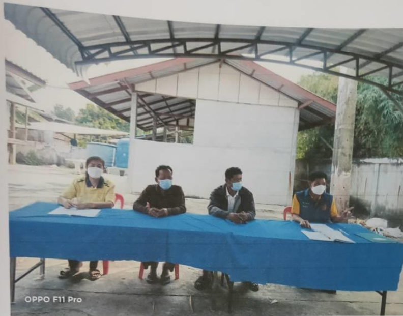
ภาพการประชุมประชาคมหมู่บ้านโนนสมบูรณ์ วันที่ 31 มกราคม 2565 ณ ศาลากลางบ้านโนนสมบูรณ์